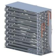
Condenseur révolutionnaire +stayclear à tubes ailetés alliant faible consommation